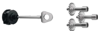
Serrure mécanique à clé MpX + 3T