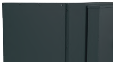
FINITION RIVETÉE SPÉCIALE « ACIER GALVANISÉ ANTI-ROUILLE »